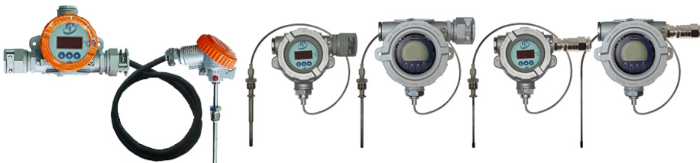
Рисунок 5 – Общий вид погружаемых кабельных взрывозащищенных ППТСК/Exd/ИНД, ППТСК/Exdi/ИНД