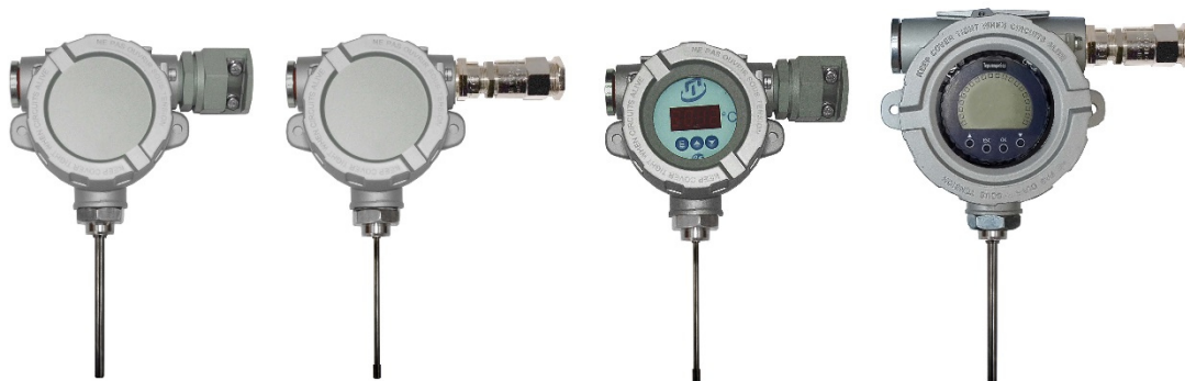
Рисунок 7 – Общий вид взрывозащищенных ППТСП/Exd, ППТСП/Exdi, ППТСП/Exd/ИНД, ППТСП/Exdi/ИНД для измерений температуры окружающей среды (воздуха)