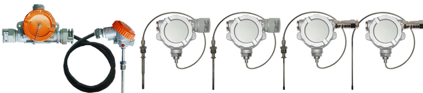
Рисунок 4 – Общий вид погружаемых кабельных взрывозащищенных ППТСК/Exd, ППТСК/Exdi