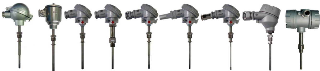
Рисунок 1 – Общий вид погружаемых общепромышленных ППТС/Оп и взрывозащищенных ППТС/Exi, ППТС/Exd, ППТС/Exdi

Фотографии общего вида ППТ представлены на рисунках 1 – 10.