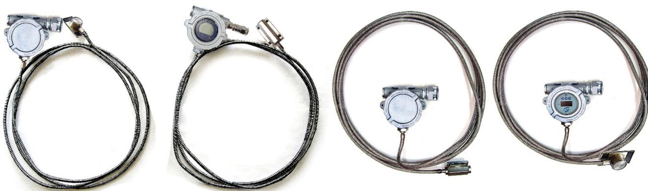
Рисунок 10 – Общий вид поверхностных общепромышленных ППТП/Оп, ППТП/Оп/ИНД и взрывозащищенных ППТП/Exd, ППТП/Exdi, ППТП/Exd/ИНД, ППТП/Exdi/ИНД с корпусами типов «К1», «К2»

Пломбирование ППТ не предусмотрено. Заводские номера в виде цифрового обозначения, состоящего из арабских цифр, нанесены на шильдики в виде табличек или на этикетки,