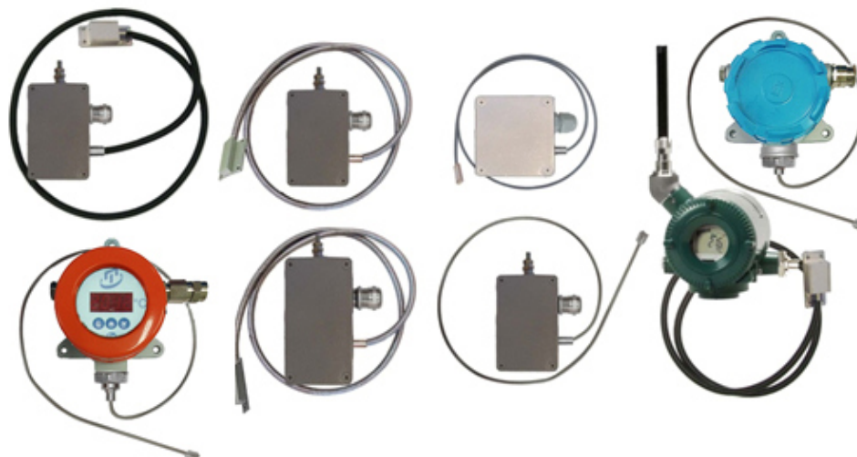
Рисунок 8 – Общий вид поверхностных общепромышленных ППТП/Оп и взрывозащищенных ППТП/Exi с корпусами типов «К3М» – «К7»