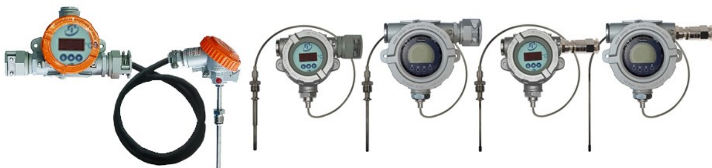
Рисунок 5 – Общий вид погружаемых кабельных взрывозащищенных ППТСК/Exd/ИНД, ППТСК/Exdi/ИНД