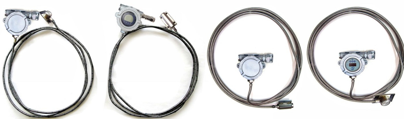
Рисунок 10 – Общий вид поверхностных общепромышленных ППТП/Оп, ППТП/Оп/ИНД и взрывозащищенных ППТП/Exd, ППТП/Exdi, ППТП/Exd/ИНД, ППТП/Exdi/ИНД с корпусами типов