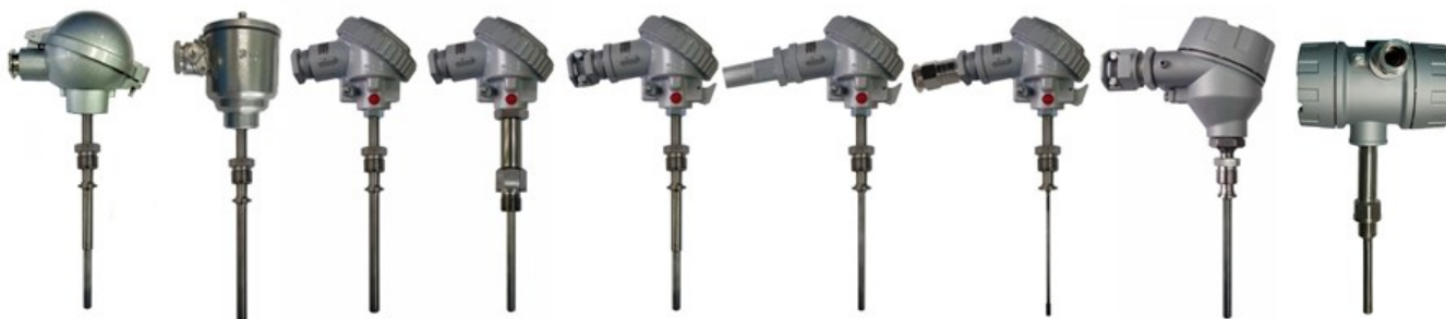
Рисунок 1 – Общий вид погружаемых общепромышленных ППТС/Оп и взрывозащищенных ППТС/Exi, ППТС/Exd, ППТС/Exdi

Фотографии общего вида ППТ представлены на рисунках 1 – 10.