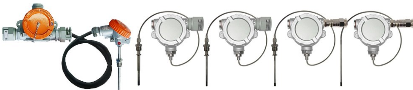
Рисунок 4 – Общий вид погружаемых кабельных взрывозащищенных ППТСК/Exd, ППТСК/Exdi