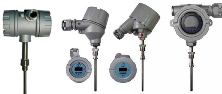
Рисунок 2 – Общий вид погружаемых общепромышленных ППТС/Оп/ИНД и взрывозащищенных ППТС/Exd/ИНД, ППТС/Exi/ИНД, ППТС/Exdi/ИНД