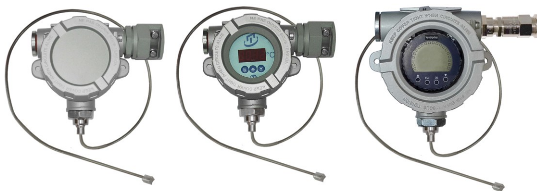
Рисунок 9 – Общий вид поверхностных взрывозащищенных ППТП/Exd, ППТП/Exdi, ППТП/Exd/ИНД, ППТП/Exdi/ИНД с корпусом типа «К7»