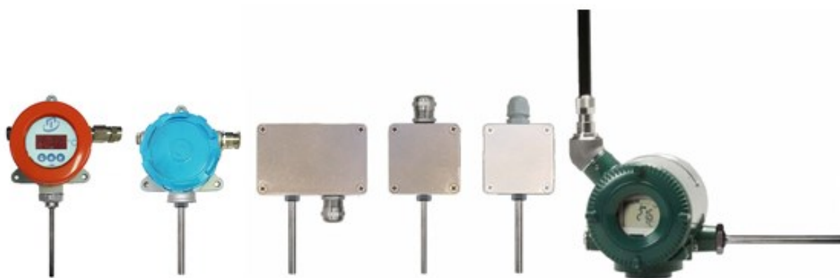
Рисунок 6 – Общий вид общепромышленных ППТСП/Оп и взрывозащищенных ППТСП/Exi для измерения температуры окружающей среды (воздуха)