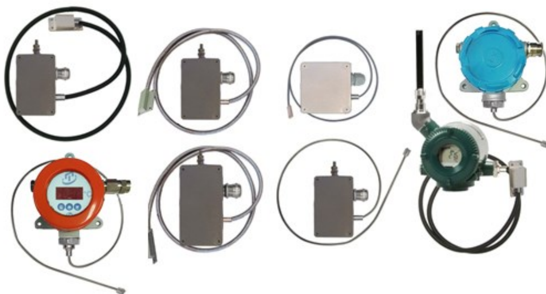
Рисунок 8 – Общий вид поверхностных общепромышленных ППТП/Оп и взрывозащищенных ППТП/Exi с корпусами типов «К3М» – «К7»