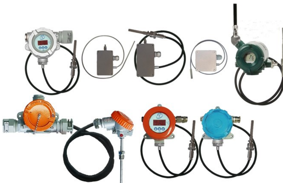
Рисунок 3 – Общий вид погружаемых кабельных общепромышленных ППТСК/Оп, ППТСК/Оп/ИНД и взрывозащищенных ППТСК/Exi, ППТСК/Exi/ИНД