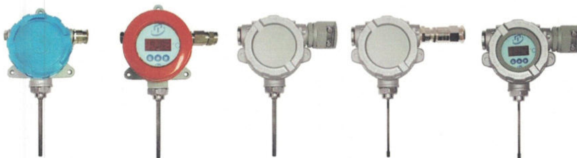
Рисунок 9 - Общепромышленные ТСп.ИНД-Оп и взрывозащищенные ТСп-Exd, ТСп-Exdi, ТСп.ИНД-Exd, ТСп.ИНД-Exdi для измерений температуры окружающей среды (воздуха)