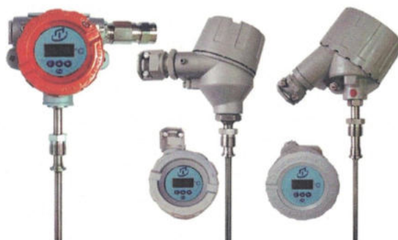
Рисунок 6 - Погружаемые общепромышленные ТС.ИНД-Оп и взрывозащищенные ТС.ИНД-Exd, ТС.ИНД-Exi, ТС.ИНД-Exdi