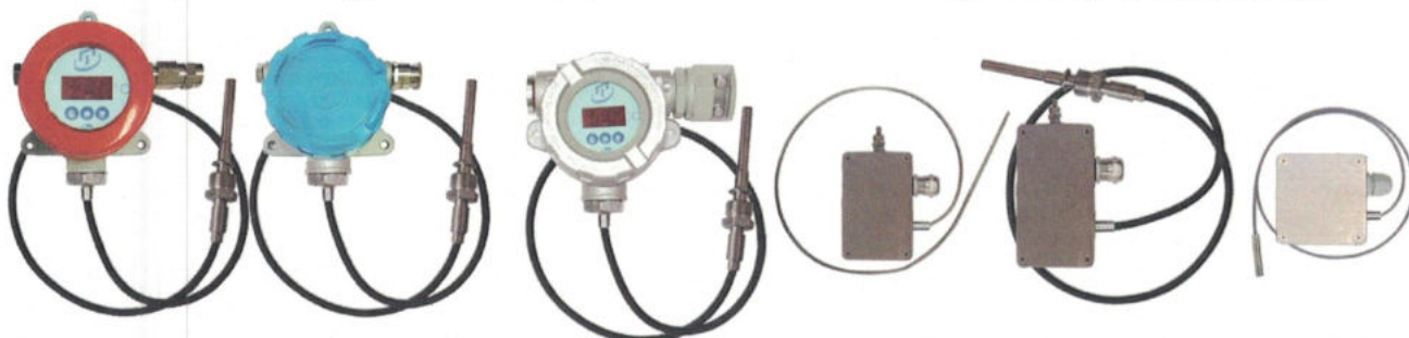
Рисунок 2 - Погружаемые кабельные общепромышленные ТС.К-Оп, ТС.К.ИНД-Оп и взрывозащищенные ТС.К-Ехi, ТС.К.ИНД-Ехi