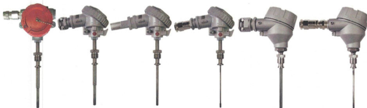
Рисунок 5 - Погружаемые взрывозащищенные ТС-Exd, ТС-Exdi