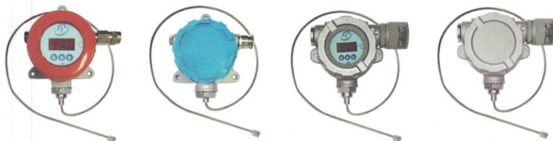
Рисунок 8 - Поверхностные общепромышленные ТС.П.ИНД-Оп и взрывозащищенные ТС.П-Exd, ТС.П-Exi, ТС.П-Exdi, ТС.П.ИНД-Exd, ТС.П.ИНД-Exi, ТС.П.ИНД-Exdi