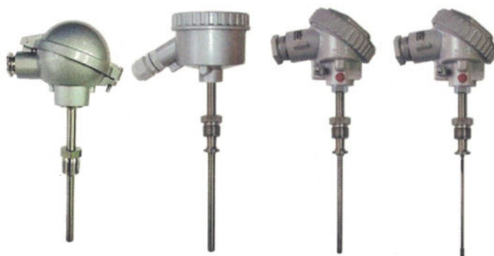
Рисунок 1 - Погружаемые общепромышленные ТС-Оп и взрывозащищенные ТС-Ехi