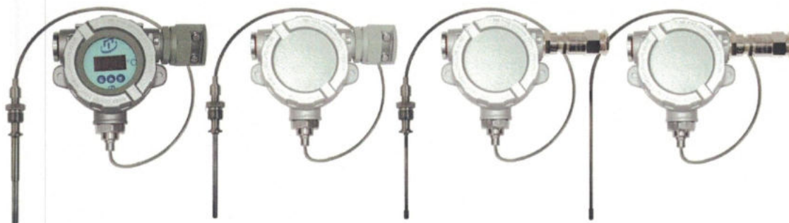
Рисунок 7 - Погружаемые кабельные взрывозащищенные ТС.К-Exd, ТС.К.ИНД-Exd, ТС.К-Exdi, ТС.К.ИНД-Exdi