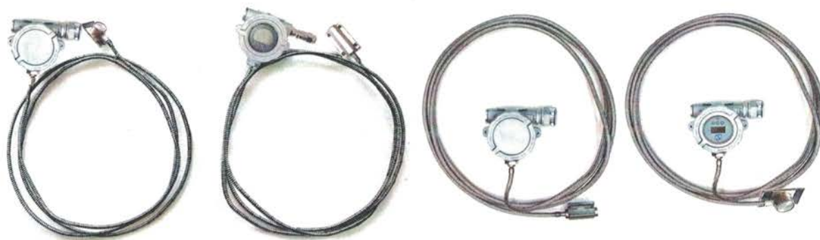
Рисунок 1 - Термопреобразователи сопротивления взрывозащищенные ТСМУ 011, ТСПУ 011

Фотографии общего вида ТС представлены на рисунке 1.